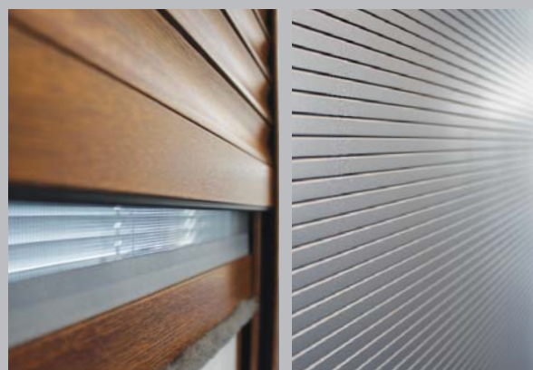
se sítí proti hmyzu