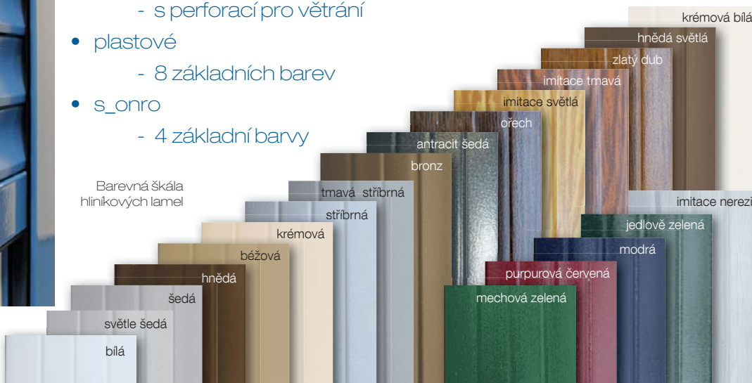
Barevná škála hliníkových lamel